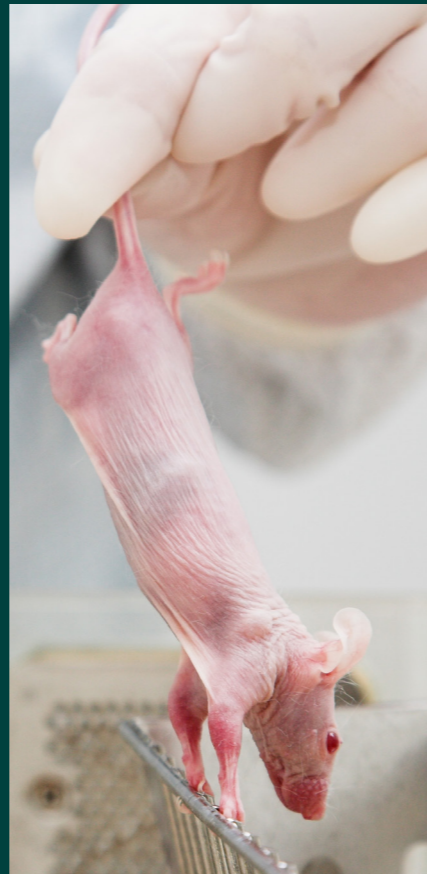
Layout: AU Grafisk Værksted, Silkeborg. Fotos: AU Foto, Colourbox

Adaptiv naturforvaltning Anvendt statistik Bananfluers genetik i praksis Biologiske effekter af miljøfarlige stoffer i havmiljøet Droner – et nyt værktøj til at overvåge naturen Dyreforsøgskundskab Effekter af undervandsstøj i havmiljøet Effects of underwater noise in the marine environment Forvaltning af danske søer og vandløb Genetik i naturforvaltningen Havets planter – økologi og bioteknologi Indsamling og artsbestemmelse af planter og dyr i vandløb Marin fauna – indsamling og artsbestemmelse Myrer og melorme på menuen – en økologisk bæredygtig fødekilde? Måling af energistofskiftet Risikovurdering af miljøfremmede stoffer Sø- og vandløbsøkologi – inspiration til gymnasielærere